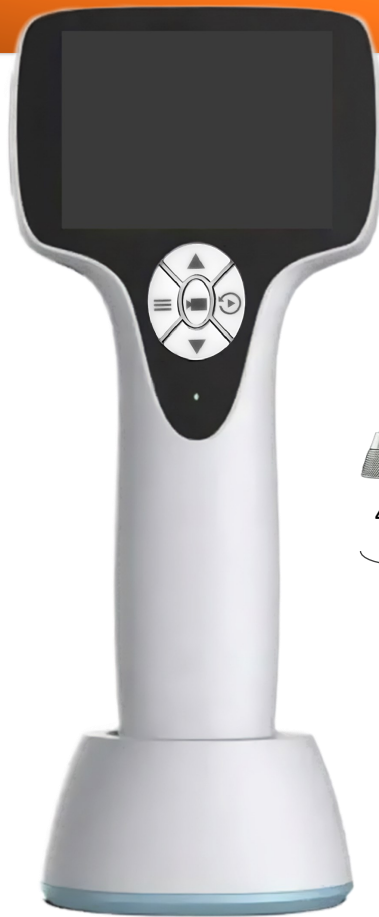
Digitales Video Otoskop/Endoskop Inkl. Ladestation